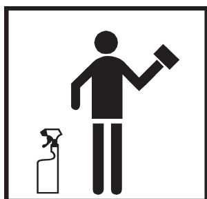
Pulverizar e limpar